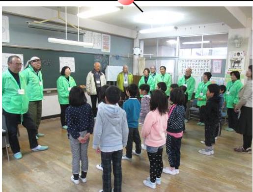
宜しくお願いします。

民生委員の皆さんにお越しいただき、1年生児童が昔遊びを教わりました。 どの子も時間を忘れて取り組みました。楽しい時間を有難うございました。