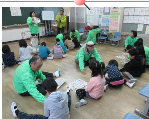
紙鉄砲を作ります。