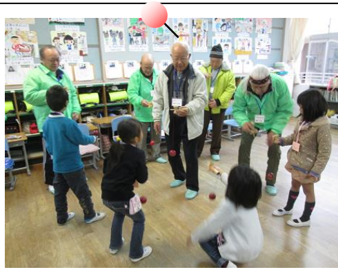
けん玉は、ひざを使うとうまくいくよ。