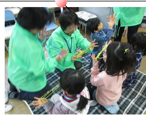
あやとり上手にできるよ！