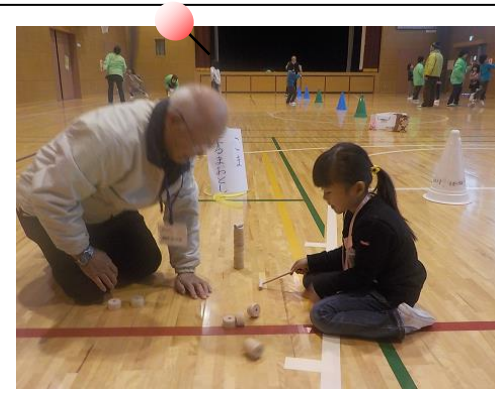
だるま落とし、うまい！