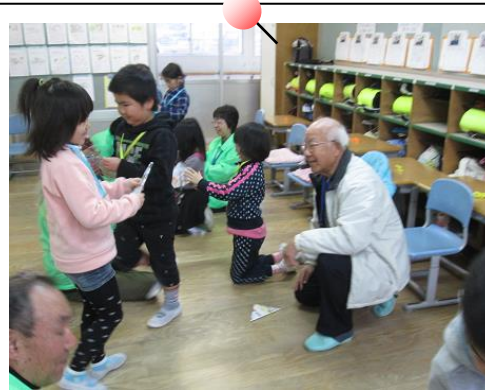
大きな音が出るかな？